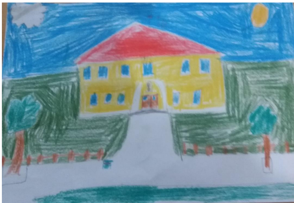
Obrázek: Honzík Ž.