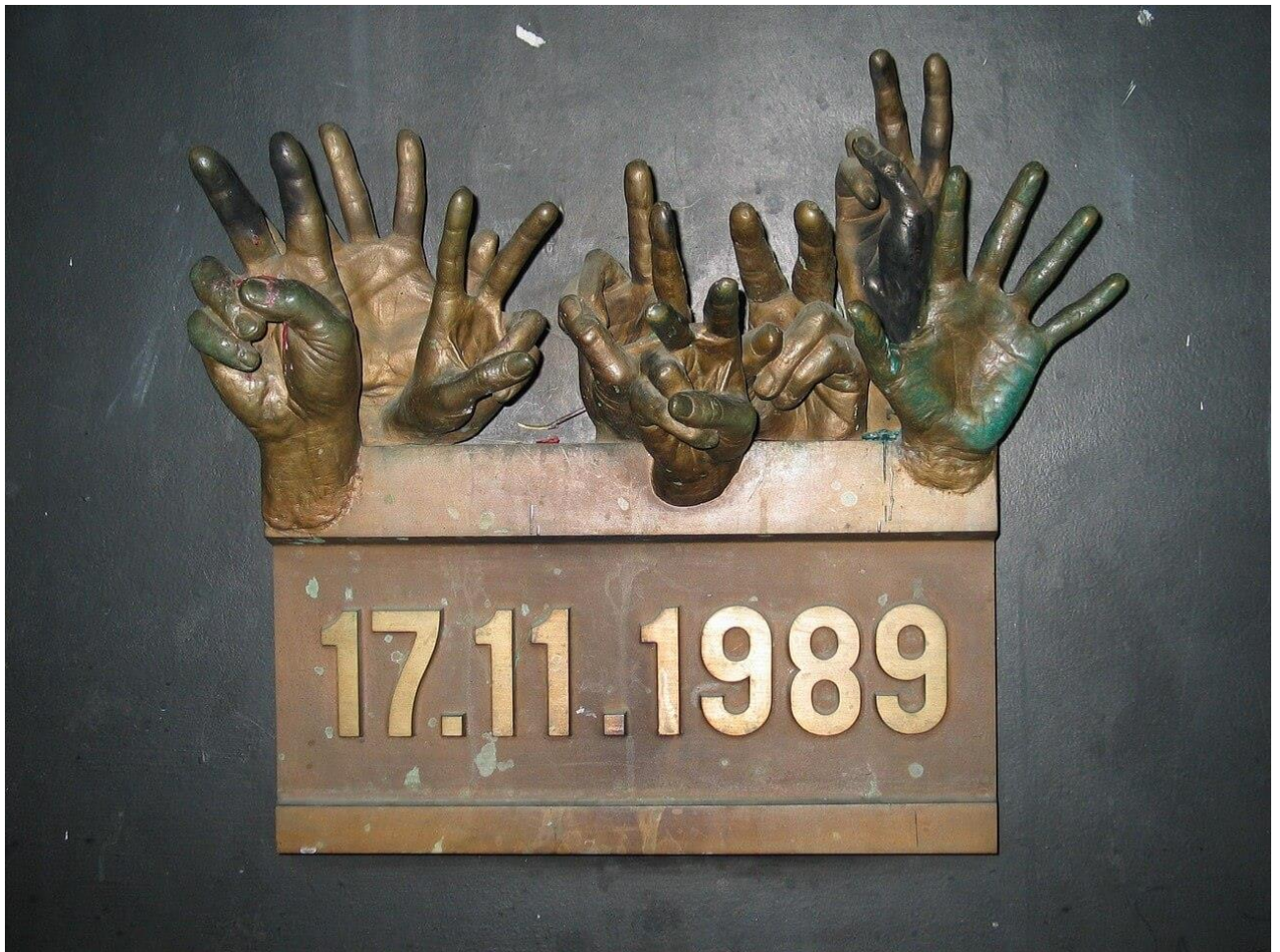
Sametová revoluce – 17. 11. 1989

V listopadu uplynulo 50 let od smutečního průvodu za Jana Opletala, zabitého při protinacistických demonstracích. Komunisté plánovali listopadové výročí oslavit jinak. Například řečením při odhalování pomníku studentům perzekuovaným nacisty. Studenti je však hodlali aktivně přihlásit k ideálům svobody a pravdy, za které jejich předchůdci položili život. Jejich průvodu se zúčastnilo několik tisíc osob.